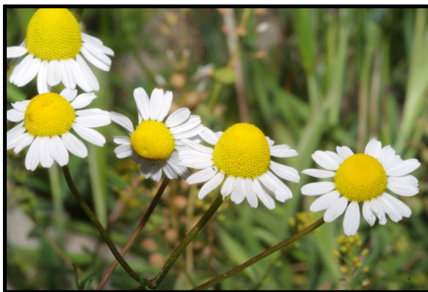
Figura 2. Detalle de Matricaria recutita L.

La Matricaria recutita L. comúnmente llamada manzanilla o manzanilla dulce (figura 2) es una planta anual, herbácea de 50cm de altura con hojas divididas en foliolos estrechos. De forma terminal presentan inflorescencias en capítulos paniculados. Las flores forman una cabezuela amarilla hueca con lígulas blancas, éstas florecen en primavera y ocupan tierras de siembras y barbechos. La particularidad del aroma de sus flores y las propiedades farmacopeas que posee ésta planta se la puede considerar como una de las plantas medicinales más importantes de nuestro país y más valoradas en el medio rural.